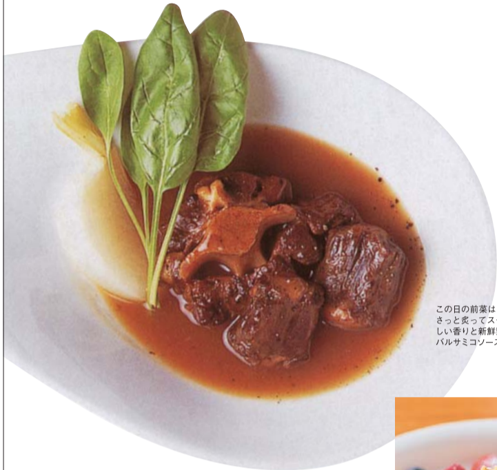
この日の前菜はカツオのサラダ仕立て。さっと炙ってスモークしたカツオの芳ばしい香りと新鮮野菜の力強い味わいを、バルサミコソースが絶妙に引き立てる