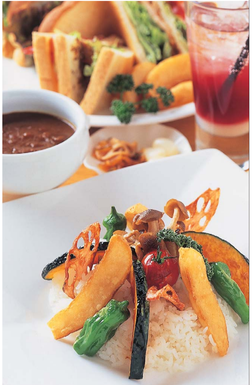
肉料理は素材の旨味をシンプルに引き出した、鹿児島茶美豚の骨付きロース肉のグリル。魚料理はトマトソースの甘みの中で唐辛子がピリリと主張する、黒メバルのクラブリア風。写真はすべておまかせディナーコース5500円より（内容は日によって替わる）