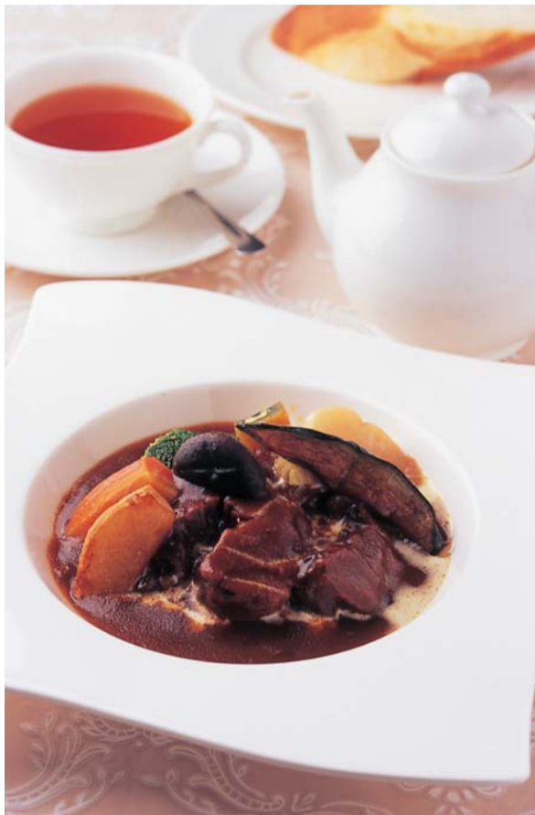
肉料理は素材の旨味をシンプルに引き出した、鹿児島茶美豚の骨付きロース肉のグリル。魚料理はトマトソースの甘みの中で唐辛子がピリリと主張する、黒メバルのカラブリア風。