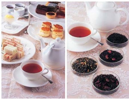
シャンパンフレーバーや、紅茶&緑茶ブレンドに甘いピーチが香るものなどすべて茶葉の販売あり