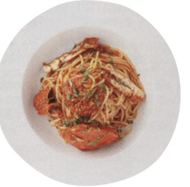
1.使い心地や肌にやさしい優しいものにこだわったアメニティ。メンバーには無料のデトックスなども用意。

心くすぐるサービス満点 スイートに癒されるホテル 神々の島といわれるバリ島の伝説的なトリートメントバリニーズ。その起源は母から子へと伝えられてきた植物を使う自然療法。王朝時代には王族の女性のアンチエイジングや美容を目的に改良され、さらに植物や花の持つ癒しのパワーによって人間を健やかな状態にリセットする、このシンブルで重要なコンセプトが、「フラン・パリ」にも息づいていると、セラピストのルさんは語る。「インドネシア出身の私から見て、フラン・パリの雰囲気は本場そのもの。木を基調にした内装や竹の家具、インドネシア音楽など、目にするもの耳にするものもバリ風で落ち着きます。ビルの中にあるとは思えないグリーンヤスな空間おもてなし。個室にて行われる。