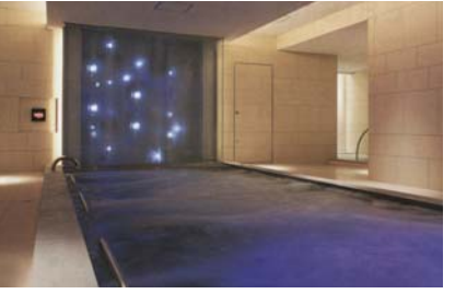
1.使い心地や肌にやさしい優しいものにこだわったアメニティ。メンバーには無料のデトックスなども用意。