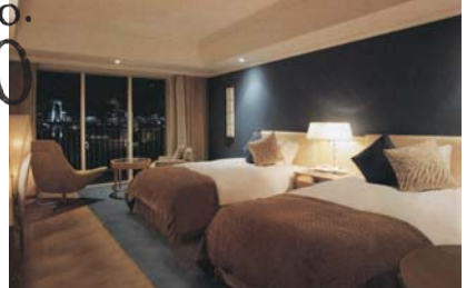
1.ゆったりベッドが心地いいエレガントな000号室。落ち着いた雰囲気なので、大人のカップルにこそおすすめ。