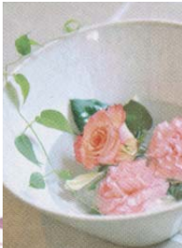
1.使い心地や肌にやさしい優しいものにこだわったアメニティ。メンバーには無料のデトックスなども用意。