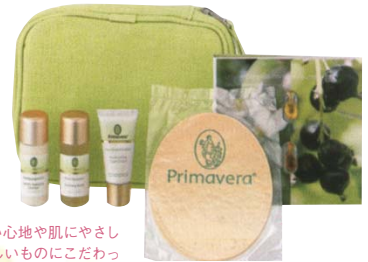
1.使い心地や肌にやさしい優しいものにこだわったアメニティ。メンバーには無料のデトックスなども用意。