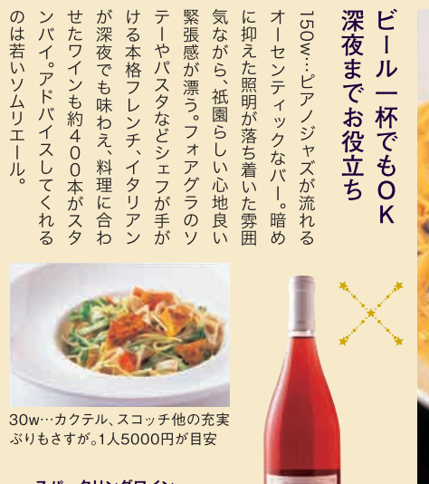
30w...カクテル、スコッチ他の充実ぶりもさすが。1人5000円が目安