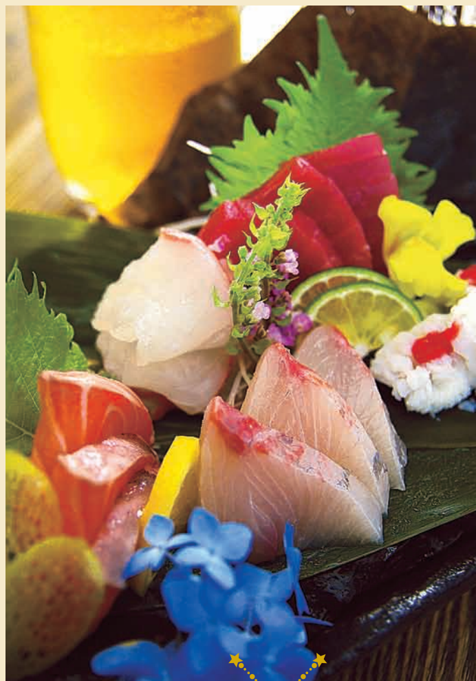
合わせ1300円。モモ、ムネ、ウデ、白肝、心臓、砂ズリなど、一羽買いならではの6種をラインナップ。一人前でこのボリューム!本日の和牛ステーキ1600円