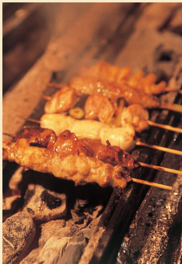
70w...地鶏刺身盛り合わせ1300円。白肝、心臓、砂ズリなど、一羽買いならではの6種をラインナップ。一人前でこのボリューム!本日の和牛ステーキ1600円

180w...1.静かにピアノジャズが流れるオーセンティックなバー。暗めに抑えた照明が落ち着いた雰囲気ながら、祇園らしい心地良い緊張感が漂う。2.フォアグラのソテーやパスタなどシェフが手がける本格フレンチ、イタリアンが深夜でも味わえ、料理に合わせたワインも約400本がスタンバイしている。3.ワインをアドバイスしてくれるのは若いソムリエールだから、女性同士で気軽に話ができそう。