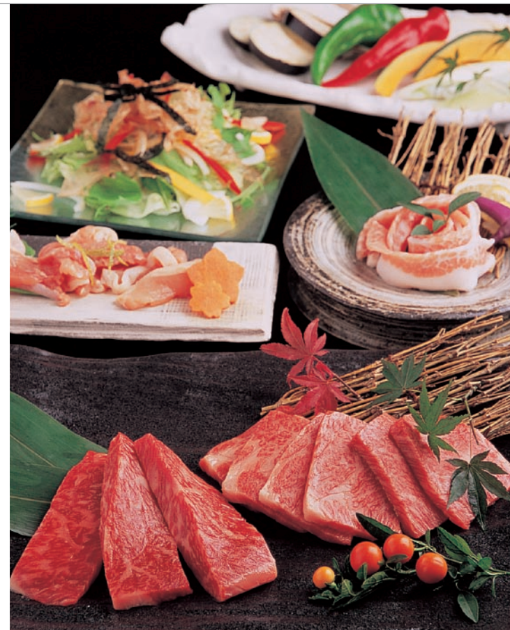
極上近江牛や希少な黒豚トロ口などがお得に味わえる「MAWARI-コース」6000円