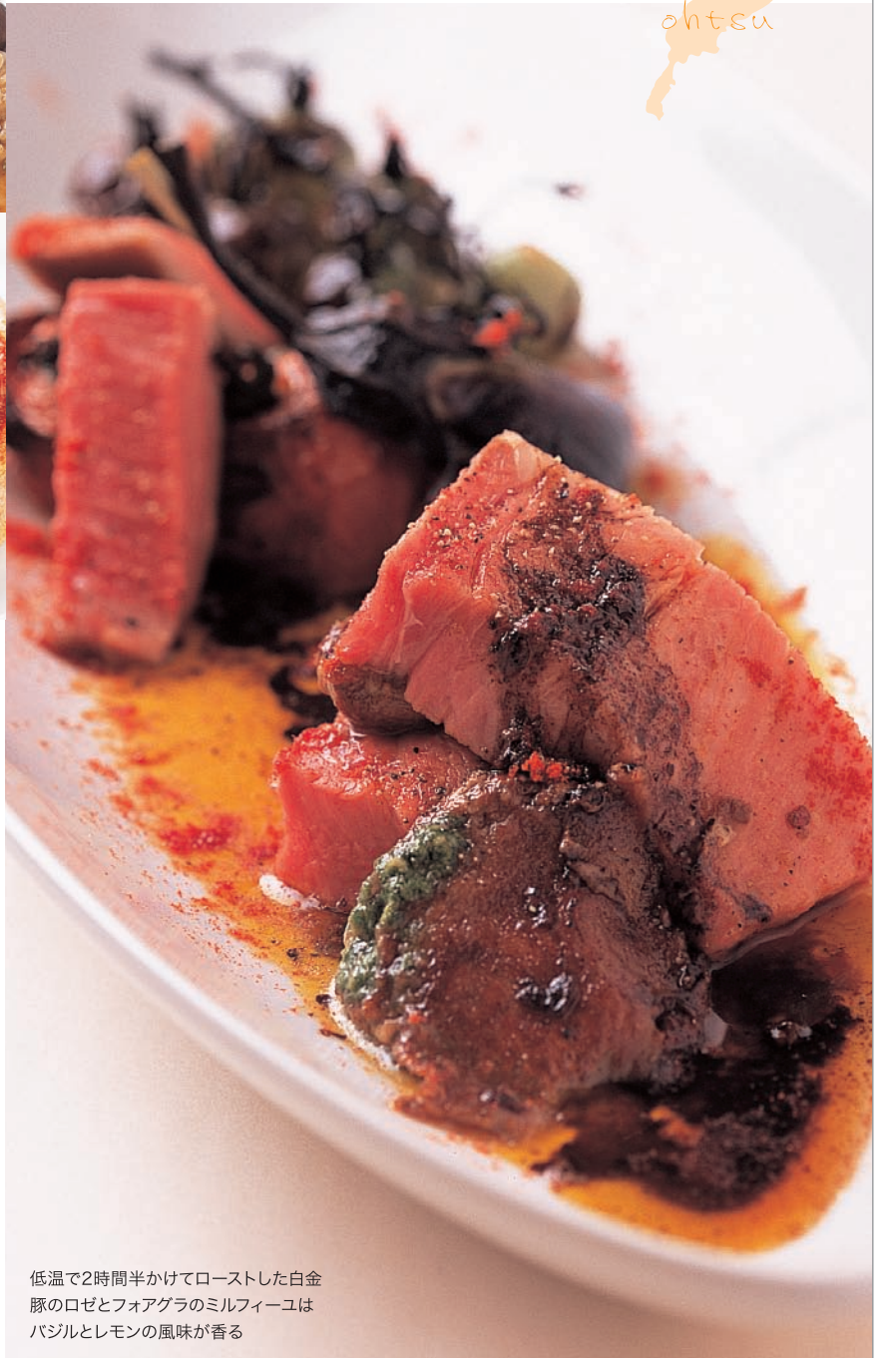
低温で2時間半かけてローストした白金豚のロゼとフォアグラのミルフィーユはパッションとレモンの風味が香る