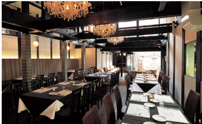
1.リクエストOKのオーダーケーキは、1万5000円〜で。2.店内の大きな水槽が幻想的な雰囲気を出します。