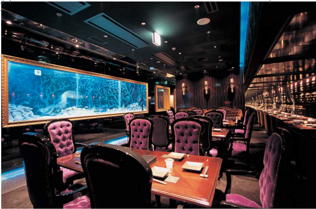
関西最大級の水槽を眺める、大人に似合うシックな空間。個室(〜5名)から着席(〜50名)、立食(〜60名)までシーンに合わせ