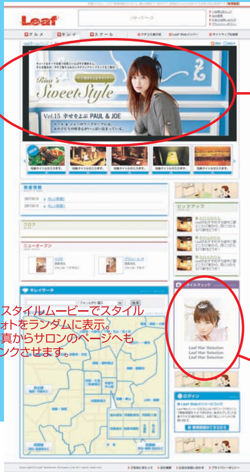
Leafクレイナビトップページ

※スタイルムービーでスタイルフォトをランダムに表示。写真からサロンのページへもリンクさせます。