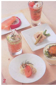
1 油で揚げることで味を凝縮させ海老の甘み。2 味噌ベースに豆板醤を加え少し辛みを利かせた。