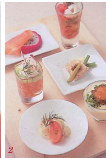
1 油で揚げることで味を凝縮させ海老の甘み。2 味噌ベースに豆板醤を加え少し辛みを利かせた。