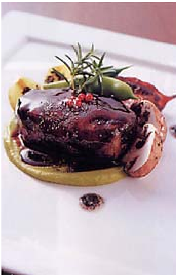
一番手前の写真はコースの野菜料理より、野菜いっぱいの蕪蒸し、菊菜あん掛け。冬は根菜類を中心に野菜が美味しい季節。旬の野菜をふんだんに使いあっさり仕上げた蕪蒸しに。