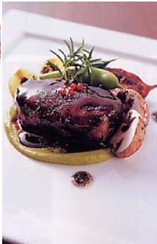
一番手前の写真はコースの野菜料理より、野菜いっぱいの蕪蒸し、菊菜あん掛け。冬は根菜類を中心に野菜が美味しい季節。旬の野菜をふんだんに使いあっさり仕上げた蕪蒸しに。